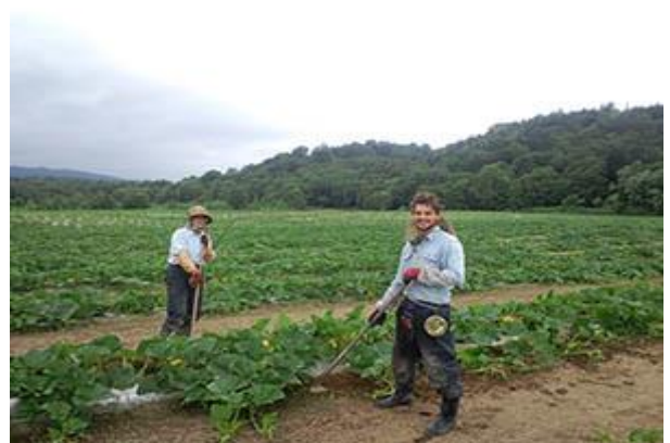
フランス人の青年もお手伝い

今農業の現場で本当に深刻に必要なのは、若い力です。農業者の平均年齢は68歳。どう考えても、今後あと10年もすれば、日本の農業者人口は急激に減ってしまいます。今北海道では何が