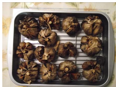
・できたての黒ニンニクです

素焼きで食べると、甘くてとてもおいしく、大満足しています。今年は、黒ニンニクをたくさん作る予定です。