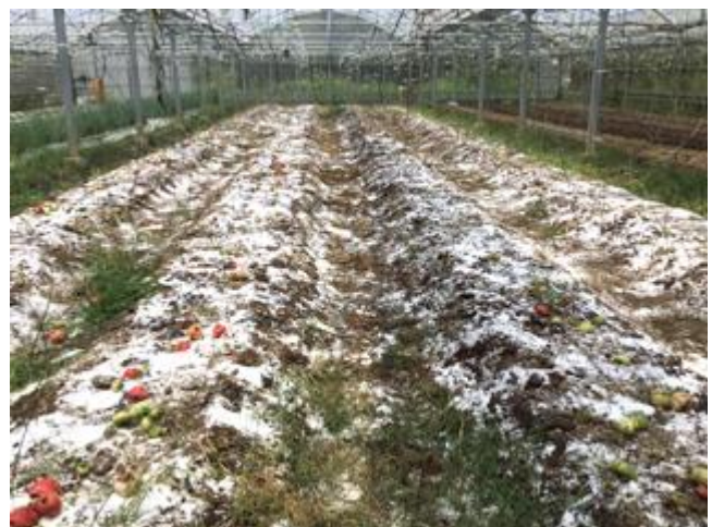
写真 1 は、EM 研究機構のサンシャインファームで、 土壌消毒、雑草抑制、土壌改良のため、10a 当り 2トンの塩を撒いた状況です。雪が積もっているよう にも見えますが、その後は、EM 活性液と灌水を行い、 EC が基準値の 2 倍くらいに調整した後に植付けしま ず。