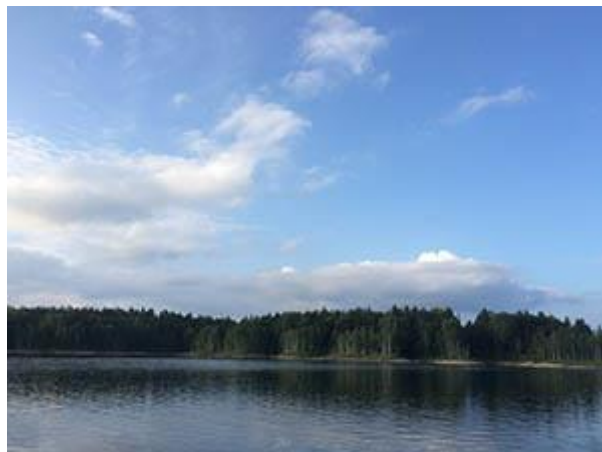
日本一のダム湖朱鞠内湖の静寂と大空